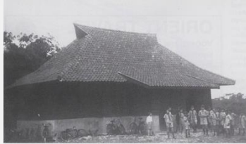
• Clubhuis met Groep Welpen Groen Groep.