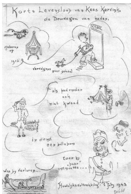
Door K.P. Bloema 2 e luitenant luchtdoel artillerie