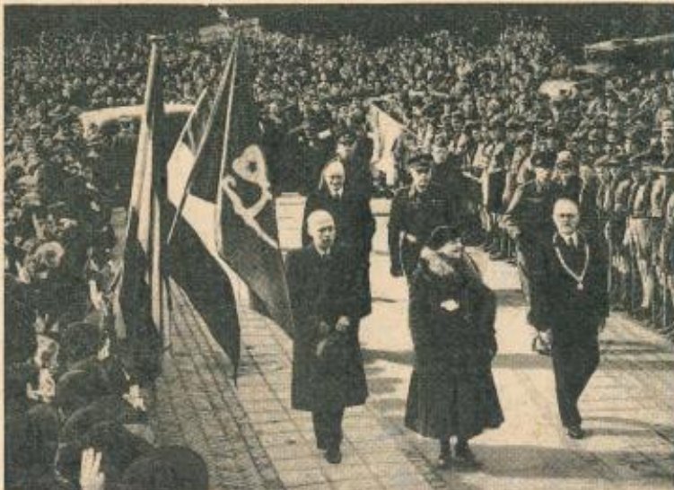
H.M. Queen Wilhelmina of the Netherlands recently visited Holland for the first time since its liberation. During her tour many Scouts and Guides appeared to welcome their Queen. Our photo shows a scene in the square at Eindhoven.

"Perhaps our name will be changed when all Holland is free!"