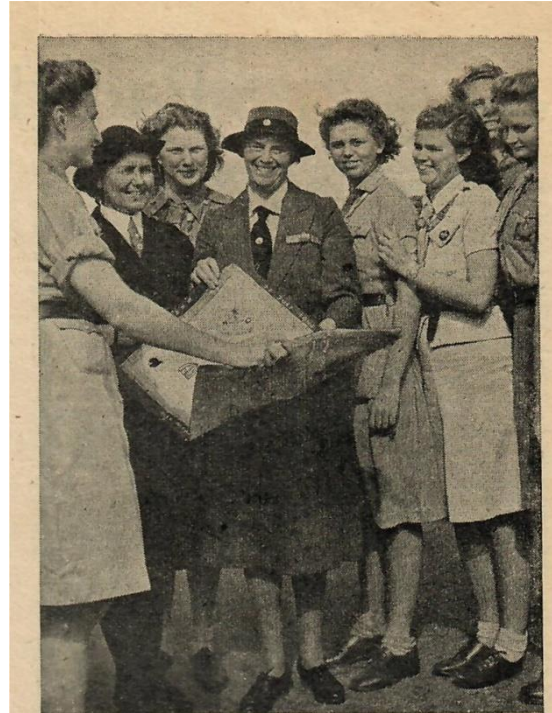
Indische padvindsters die tijdens de Japansche bezetting in het interneringskamp clandestien een padvindstersgroep vormden, zijn met hun leidster op Schiphol bijeengekomen om Lady B. P. te verwelkomen en haar een eigengemaakte mat met hun totems aan te bieden.