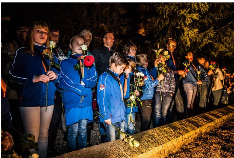
Herdenking van het bombardement op Huissen 2 oktober 2019