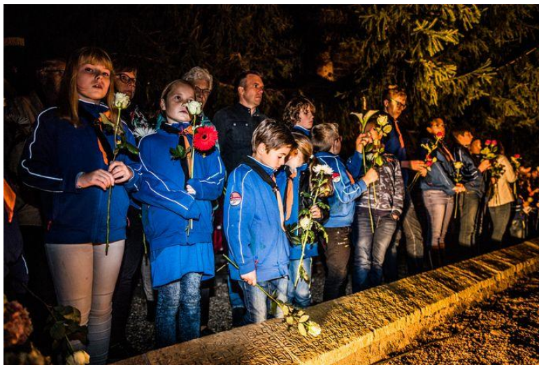
Herdenking van het bombardement op Huissen, 2 oktober 2019