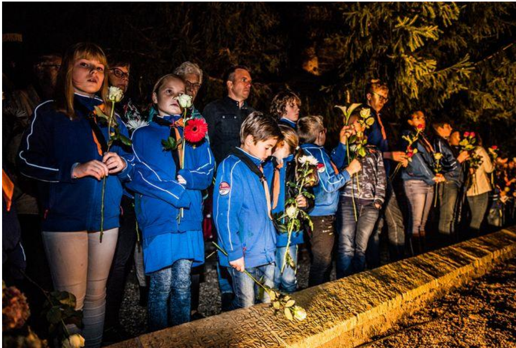
Herdenking van het bombardement op Huissen 2 oktober 2019

Dit verhaal is onderdeel van Scouts in de oorlog , een verzameling verhalen als eerbetoon aan al die (oud) scouts die zich ingezet hebben voor onze vrijheid en hulp aan de medemens of die slachtoffer werden van oorlogsgeweld, in Nederland en het verre oosten. Met de verhalen willen we inspiratie bieden aan de scouts van nu, in hun wekelijkse activiteiten en als voorbereiding op hun bijdrage aan lokale herdenkingen. Kijk op http://vrijheid.scouting.nl voor meer informatie en alle andere verhalen.