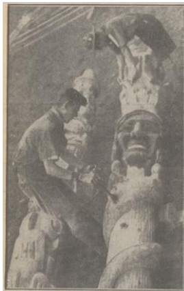
TWEE „TOTEMPALEN“ — voor het Jamboree-terrein te Vogelenzang, vervaardigd door een padvinder. De 900 k.g. wegende palen.