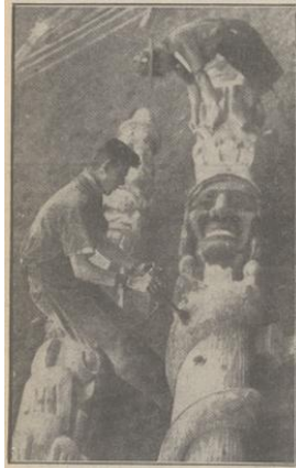
TWEE „TOTEMPALEN” — voor het Jamboree-terrein te Vogelenzang, vervaardigd door een padvinder. De 900 k.g. wegende palen.