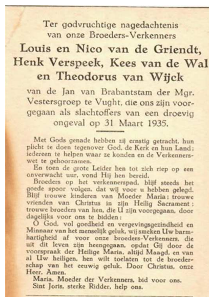
bidprentje van de omgekomen roverscouts